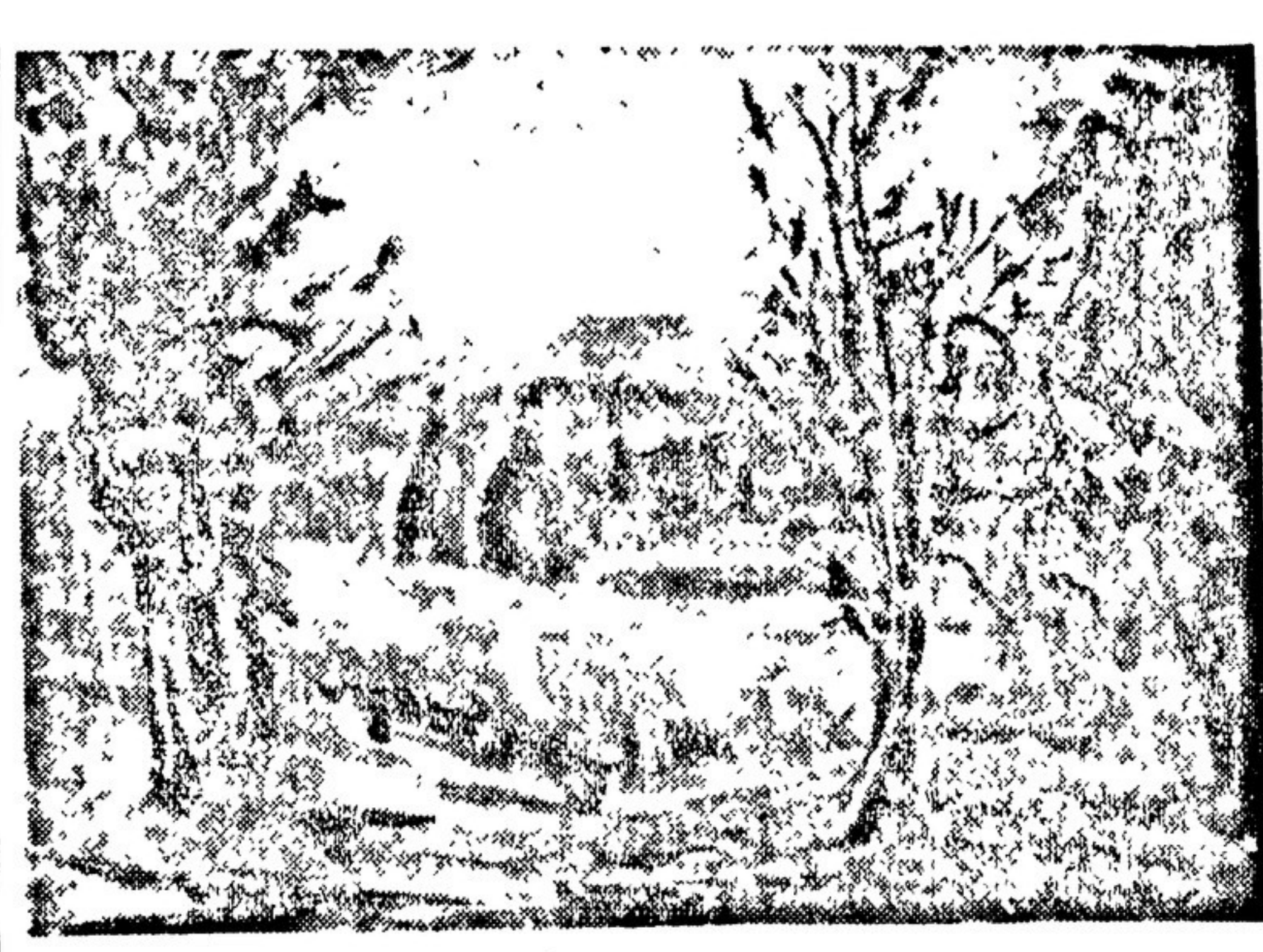
Украинский пейзаж. Художник Н. ГЛИМЧЕНКО.